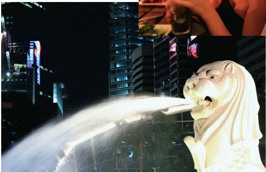
Singapores symbol: Merlion