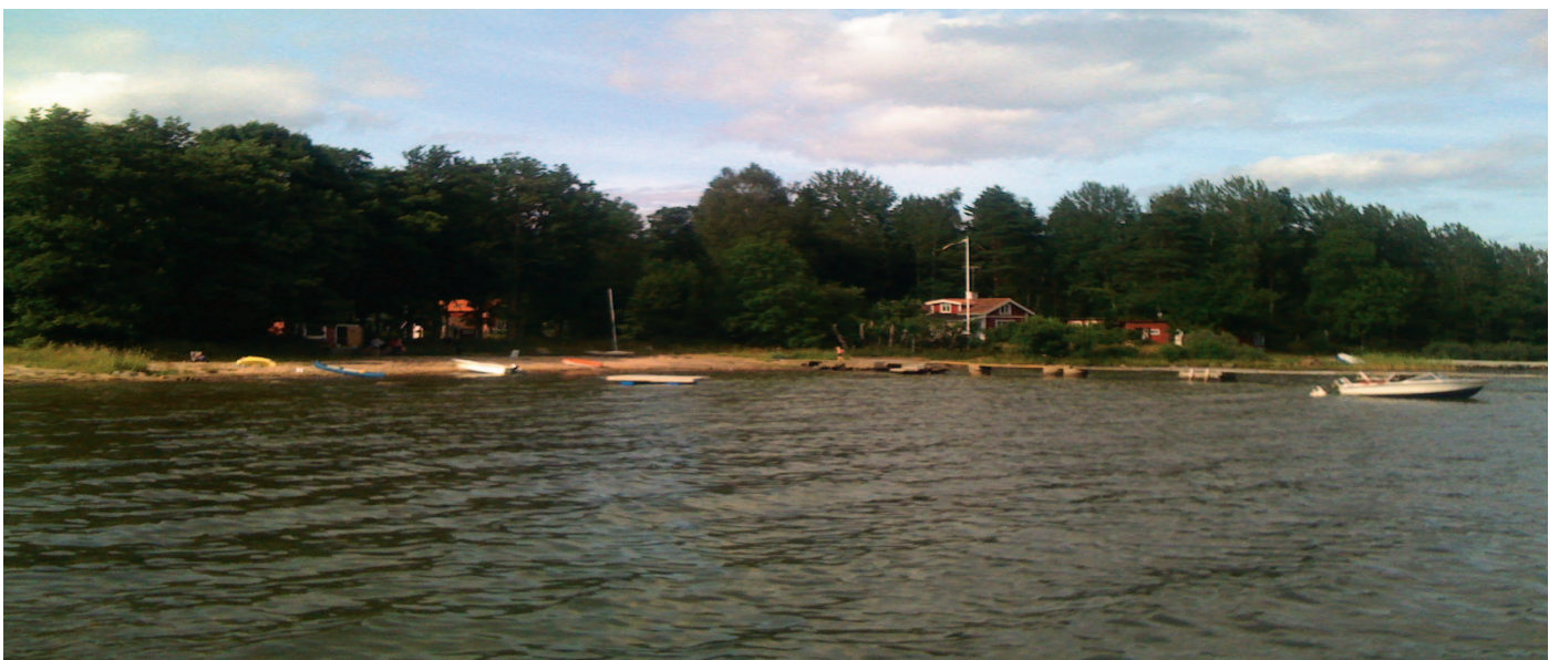
Den hermelinska sommarstugan på Björkö.