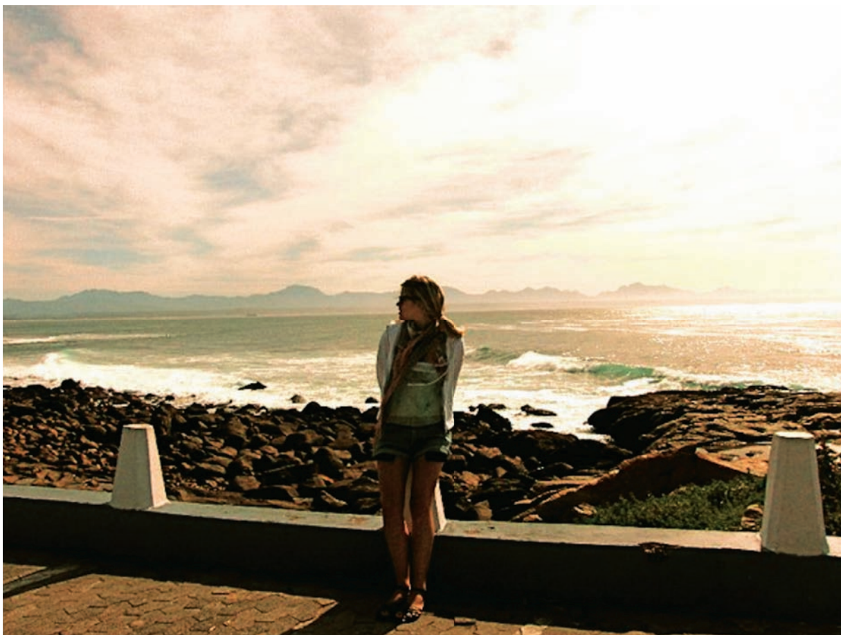
Cornelia vid Mossel Bay i Sydafrika

Under höstterminen i trean fick vi möjlighet att åka utomlands och studera. Jag och en vän kom då på idén att i stället studera på distans under den terminen och på så sätt hinna med massor av olika ställen i världen, istället för bara ett. Sagt och gjort: Under den hösten läste jag nationalekonomi i Sydafrika, Spanien och England – och, inte att förglömma, i det exotiska paradiset Blixta, Söderköping, som jag också hann med att besöka några gånger. Det var minst sagt en ombytlig termin. Och det var klart mer motiverande att studera på en