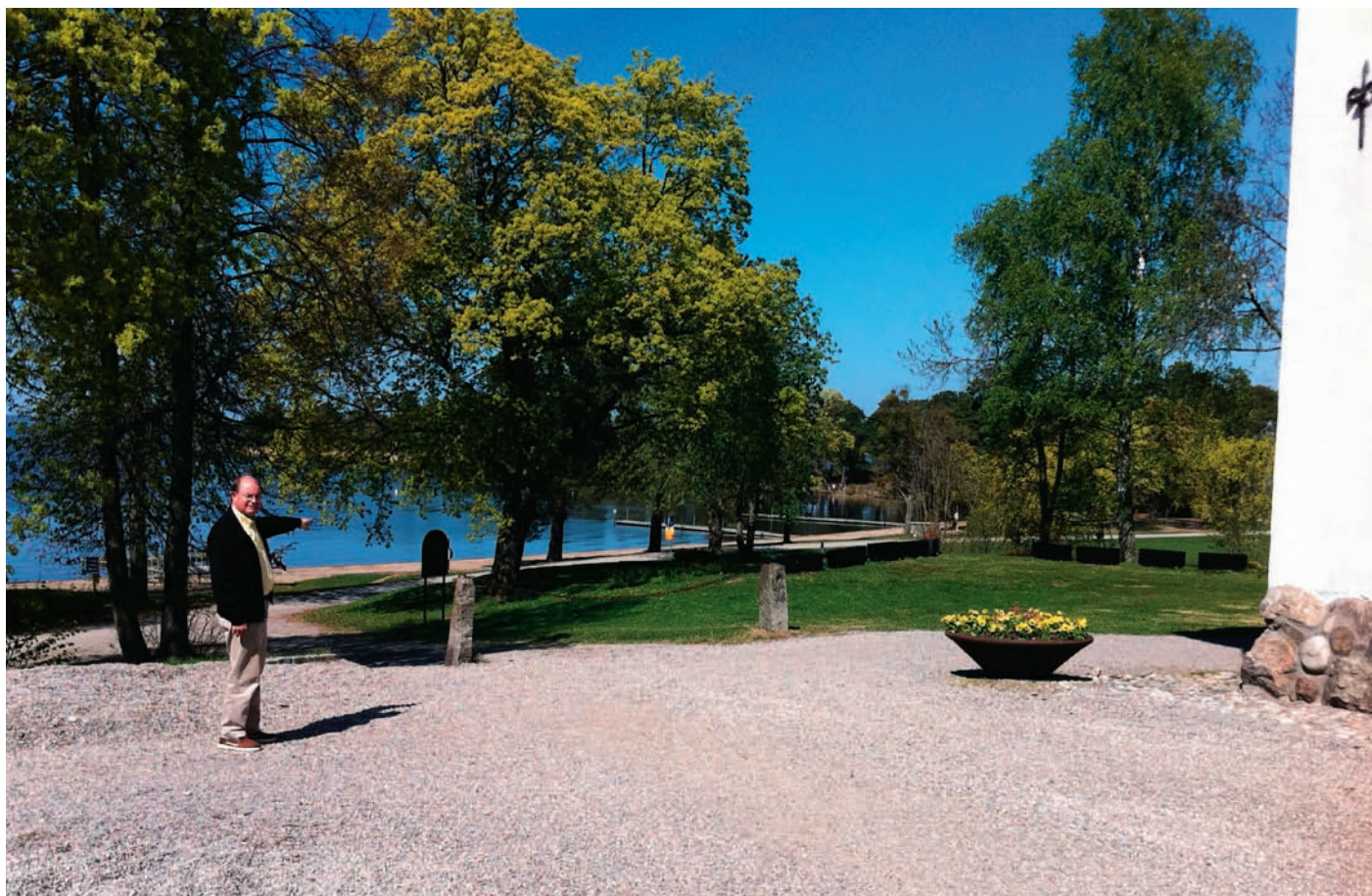
Fredrik Hermelin pekar ut badplatsen.

Efter frukosten erbjuds olika miniseminarier, där ett antal släktingar kommer att berätta om sina liv, yrken eller speciella erfarenheter. Det kommer att bli en intressant släktexposé och ett utmärkt tillfälle för nätverkande. Utcheckning och betalning av rum sker senast klockan 12.00. Vårt 100-årsjubileum avslutas med gemensam lunch klockan 13.00.