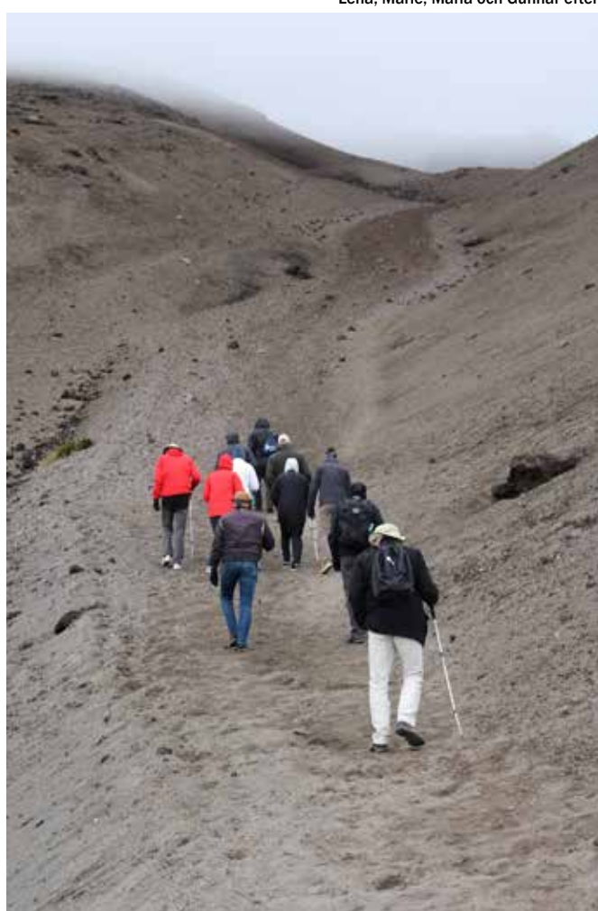
Uppför, uppför, uppför

vi somnade tämligen ovaggade på kvällen.