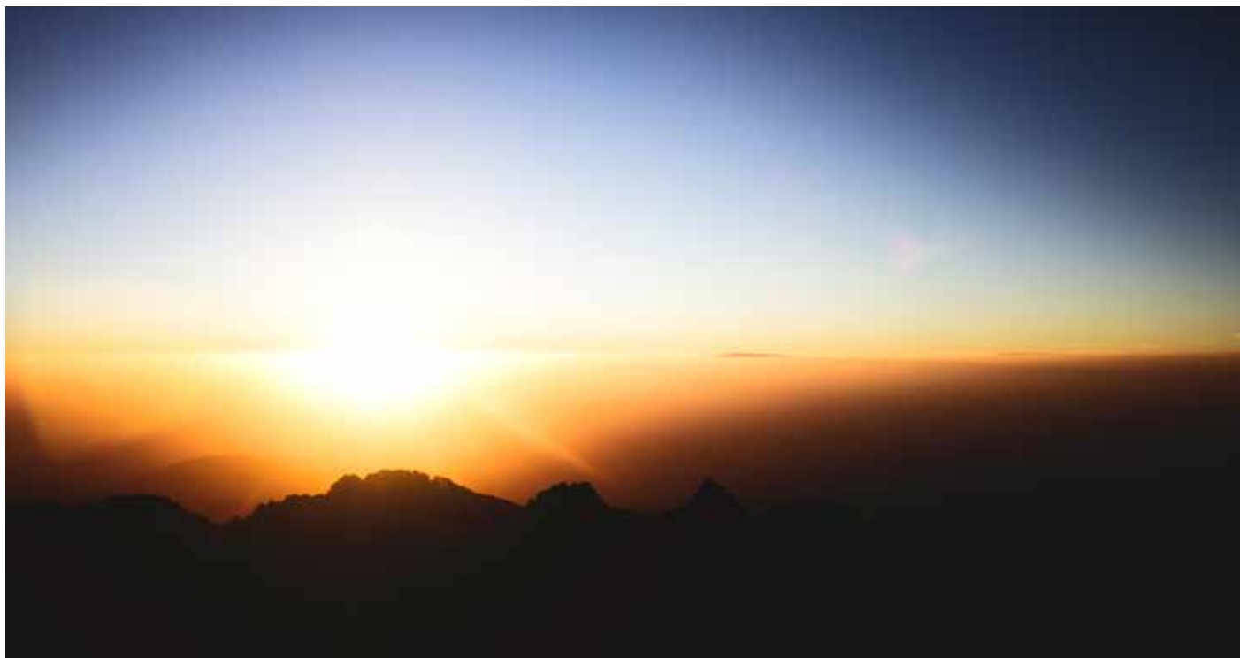
Soluppgången sedd från Mount Kenya

Att åka till Kenya var mitt livs bästa beslut. Trots allt funderande är jag oerhört glad att jag bestämde mig för att åka till slut. Jag växte oerhört mycket som person och fick med mig erfarenheter och lärdomar som jag kommer bära med mig livet ut.