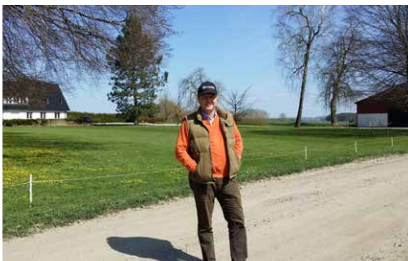
Artikelförfattaren själv, dagen när Karups Gård köptes