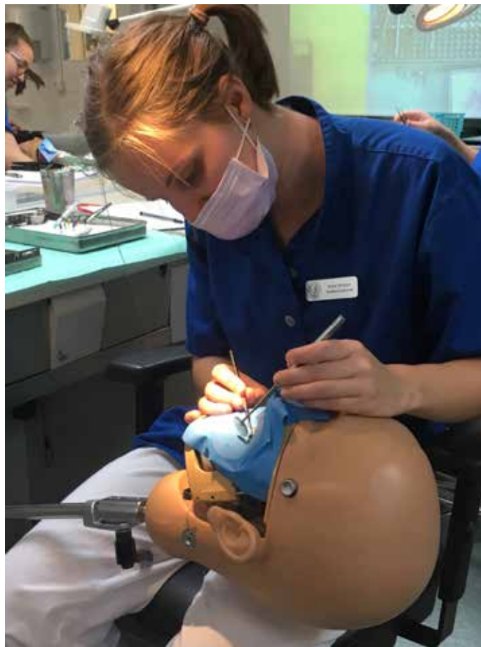
Här tränar jag på att göra rotfyllningar på den ständigt glada dockan Oscar