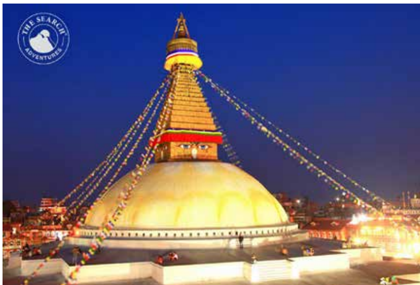
Boudhanath Stupa i Katmandu

Vi återvänder sedan till hotell Dwarika för en mycket speciell middag på deras egen restaurant Krishnarphan. En oförglömlig kulinarisk upplevelse.