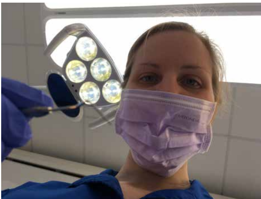
Så här upplever mina patienter mig ofta

Jag är även engagerad i det internationella utskottet på skolan. Där vi har tagit emot tandläkarstudenter från hela Europa genom organisationen European Dental Student Association, EDSA. Påsken 2017 åkte jag och fem andra studenter från Malmö till Cardiff i Wales för EDSA:s kongress.