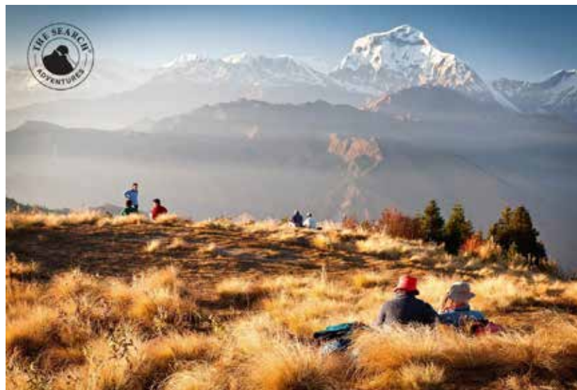
Poon Hill i Pokhara

huphutinath-templet, och upptäcker templets uråldriga traditioner. Vi återvänder till hotellet i god tid innan middagen som serveras på en speciellt utvald restaurang.