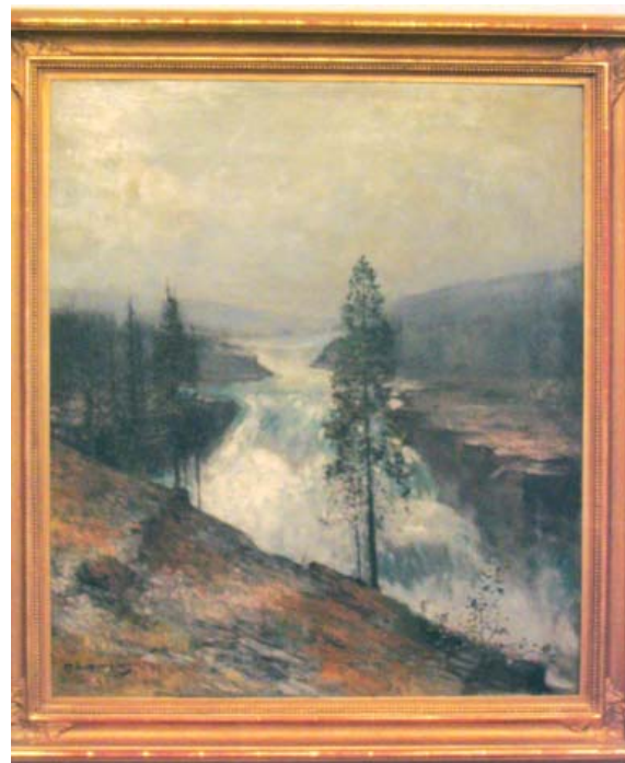
Disig dag vid porjusfallen olja på duk daterad 1911

Tavlan lär ha hängt på vägen i en Hermelinfamiljs barnkam-mare på 20 talet.