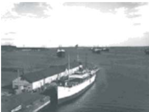
Luleå, vy från hamnkontoret mot hamnpiren i slutet av 1930-talet. Vid kajen ligger Sveabolagets fartyg S/S Egil, tidigare under namnet Samuel Gustaf Hermelin.

Under en period fram till mitten av 1930-talet var även en ångbåt uppkallad efter Samuel Gustaf, fartyget som ägdes av Sveabolaget trafikerade sträckan Luleå - Norrköping ända fram till 1930-talet.