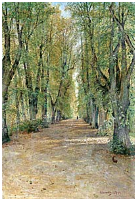
PARKINTERIEUR. Daterad 14/9 1894. Duk 132 x 91 cm.