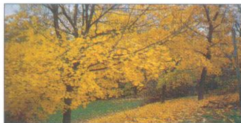
Höstlöven faller vid strandpromenaden utmed Barnbusviken