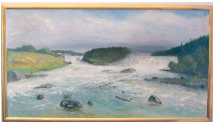
Landskap med fors olja på duk daterad 1902