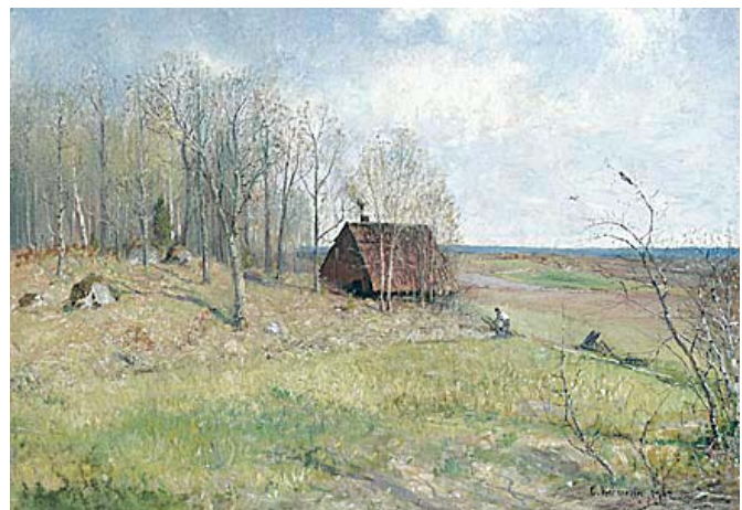
VÅRENS FÖRSTA DAG. Daterad 1902. Duk 72,5 x 101 cm.