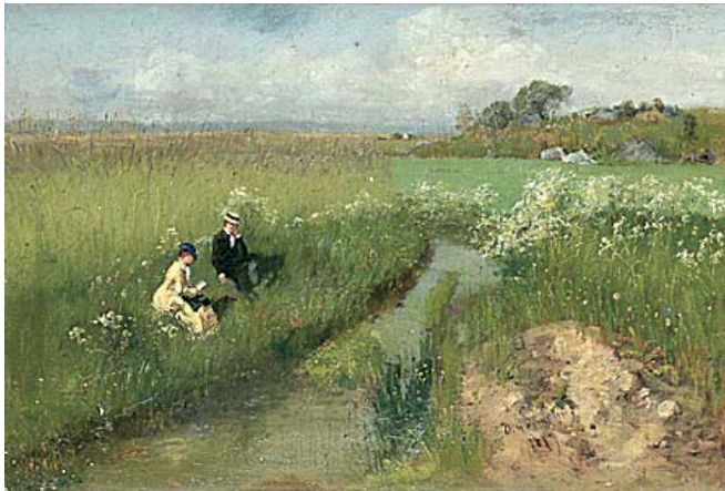
RASTANDE PAR VID VATTENDRAG. Daterad 1879. Duk 42 x 61 cm.

Med utropspriser på mellan 25.000:- och 45.000:-