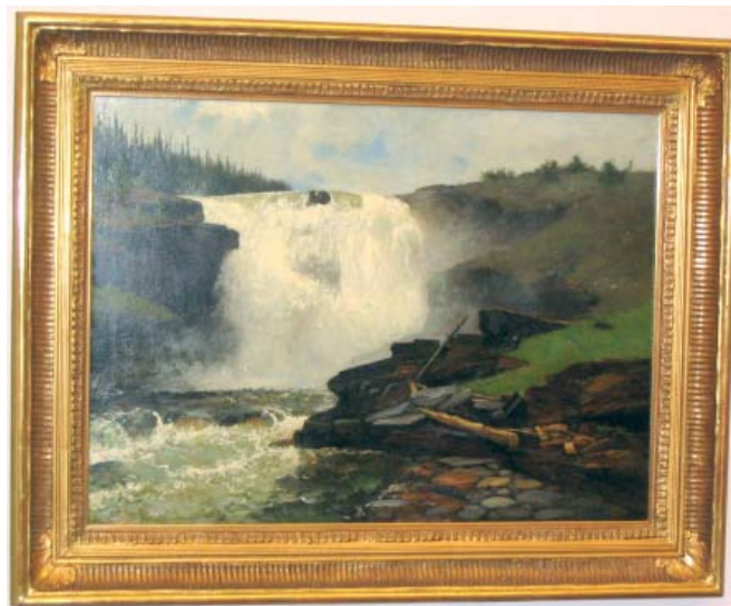
Tännforssen olja på duk odaterad

Även ovanstående tavla hänger i Vattenfall AB:s lokaler den köptes in på auktion i början av 90-talet för runt 15.000:-. På baksidan stod att läsa ”Till O Ahlin från vännen O.H”