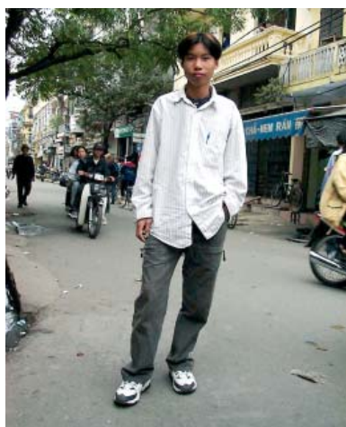
Vuong i Hanoi centrum

Nu i december kommer turisterna till Hanoi. Jag hoppas