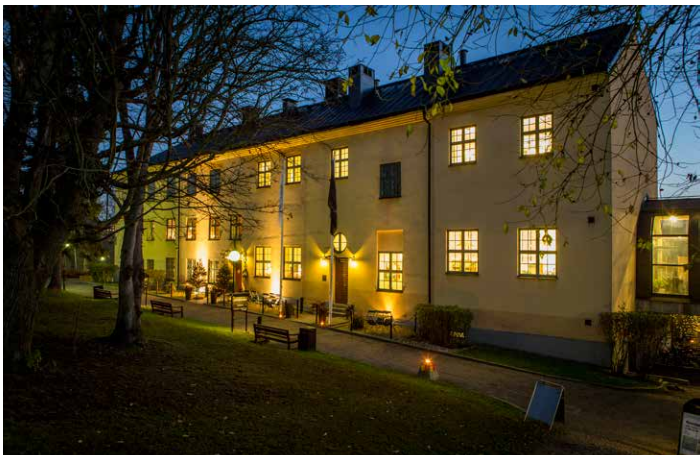
Värdshusbyggnaden redo för middagsgäster