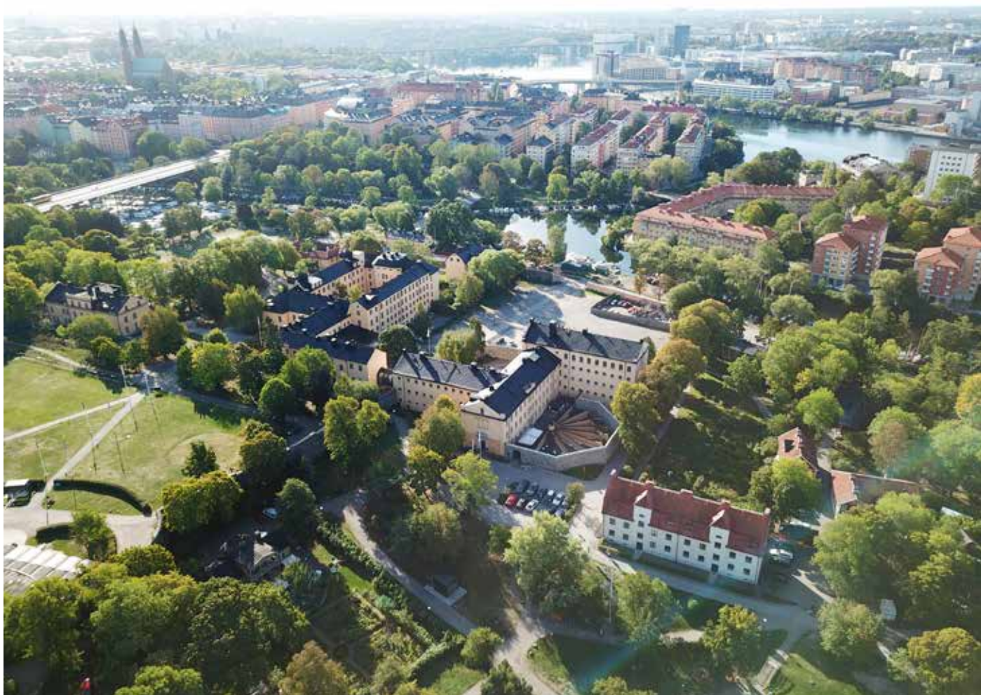
Långholmen sett från ovan

De lite mer aktiva aktiviteterna sker både utomhus och inomhus oavsett väder, så vill ni delta i dem är det bra med kläder som passar både utelek och fin middag inne. Annars gäller ledig klädsel.