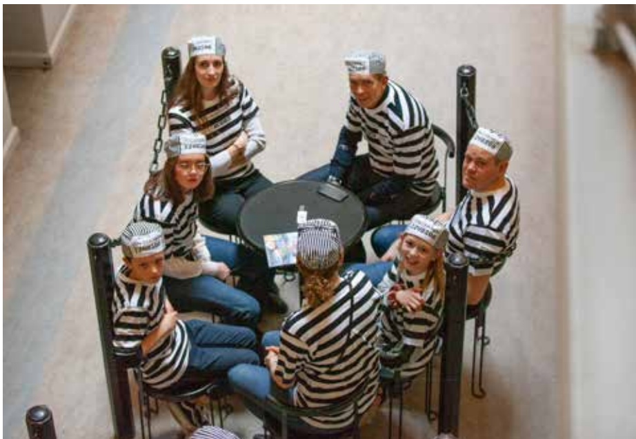
Vinnarna i Fångkampen: Lag 4!

som ledde till olika platser, både inne och ute. Vi hade inte särskilt gott om tid, så det gällde att vara strategisk och snabb för att lyckas hinna fram och hitta låsen innan något annat lag hann göra det.