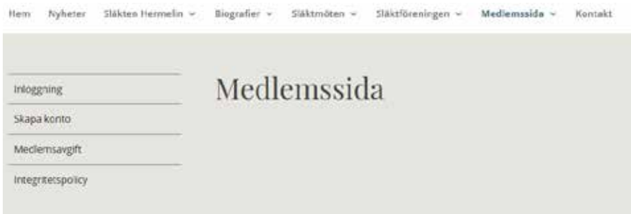
På medlemssidan kan du skapa ditt konto och du kan få ett nytt lösenord om du glömt ditt gamla