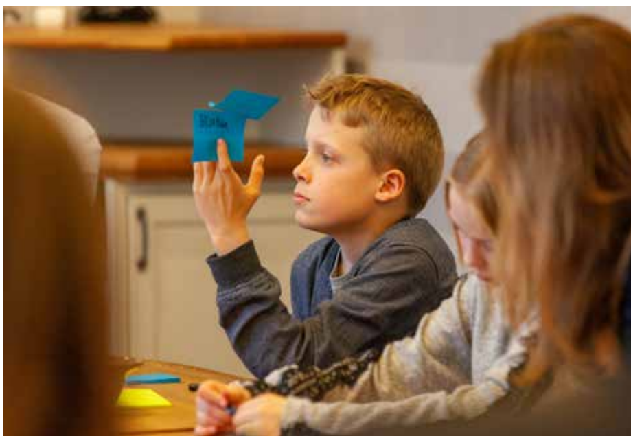
Många idéer kom upp när våra unga släktingar fick chans att bidra med sina tankar