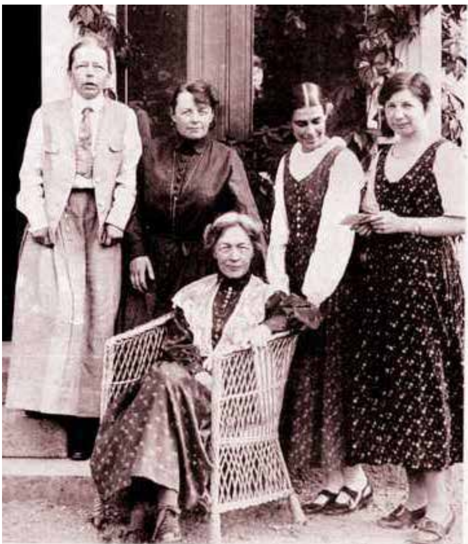
Fogelstadskvinnorna fångade på samma bild. Stående från vänster Elisabeth Tamm, Ada Nilsson, Honorine Hermelin och Elin Wägner. Sittande Kerstin Hesselgren.