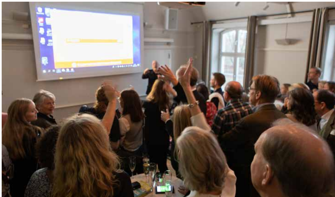
Full fart och full uppmärksamhet när våra kunskaper om släkten testades under Kahoot

Men hur det var så fipplade jag runt med mobilen och plötsligt så kunde jag