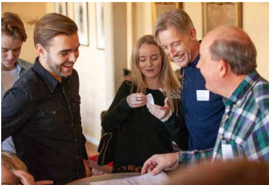
Glada miner vid incheckningen

Till vår hjälp fanns ett 30-tal ledtrådar