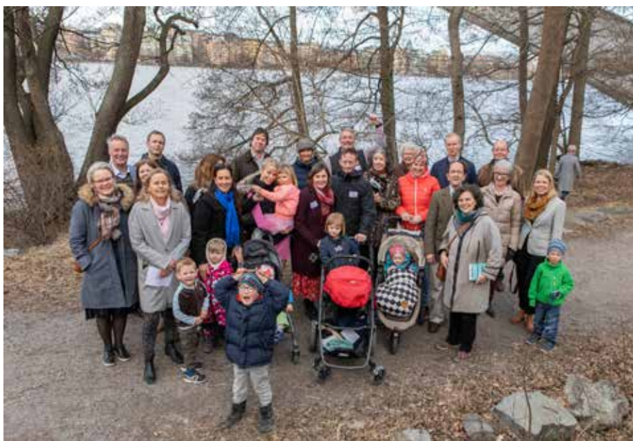
Tipsrundegänget ute på sin promenad