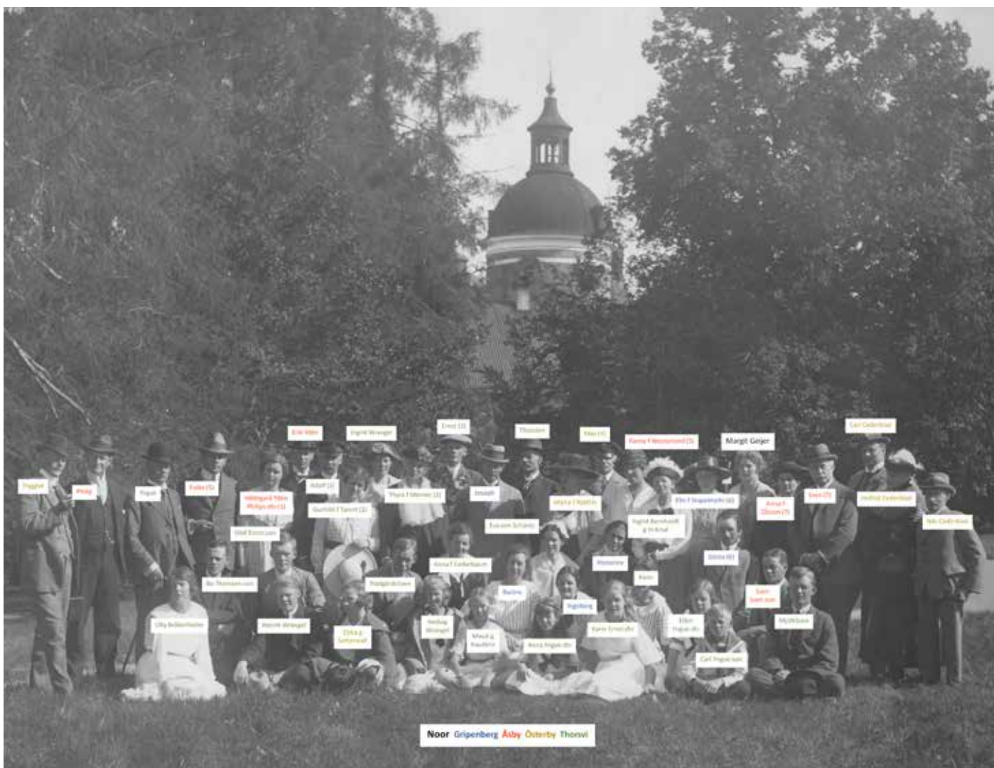
Gruppenbild från släktmötet i Mariefred 1921