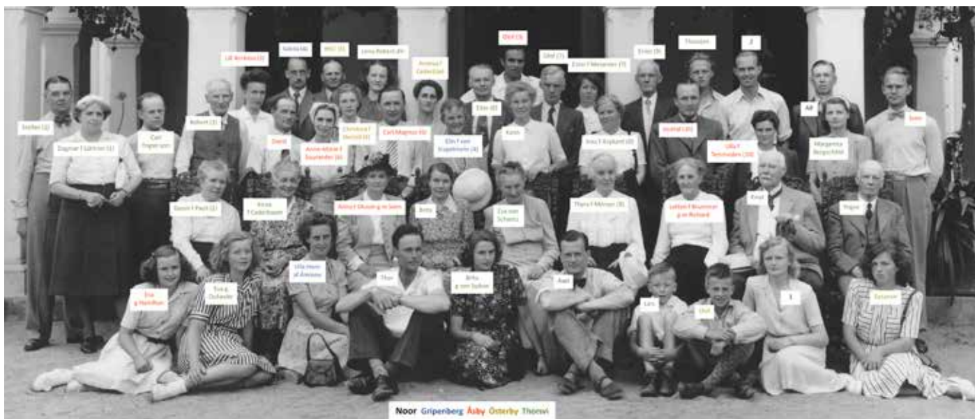
Gruppenbild från släktmötet i Eskilstuna 1947