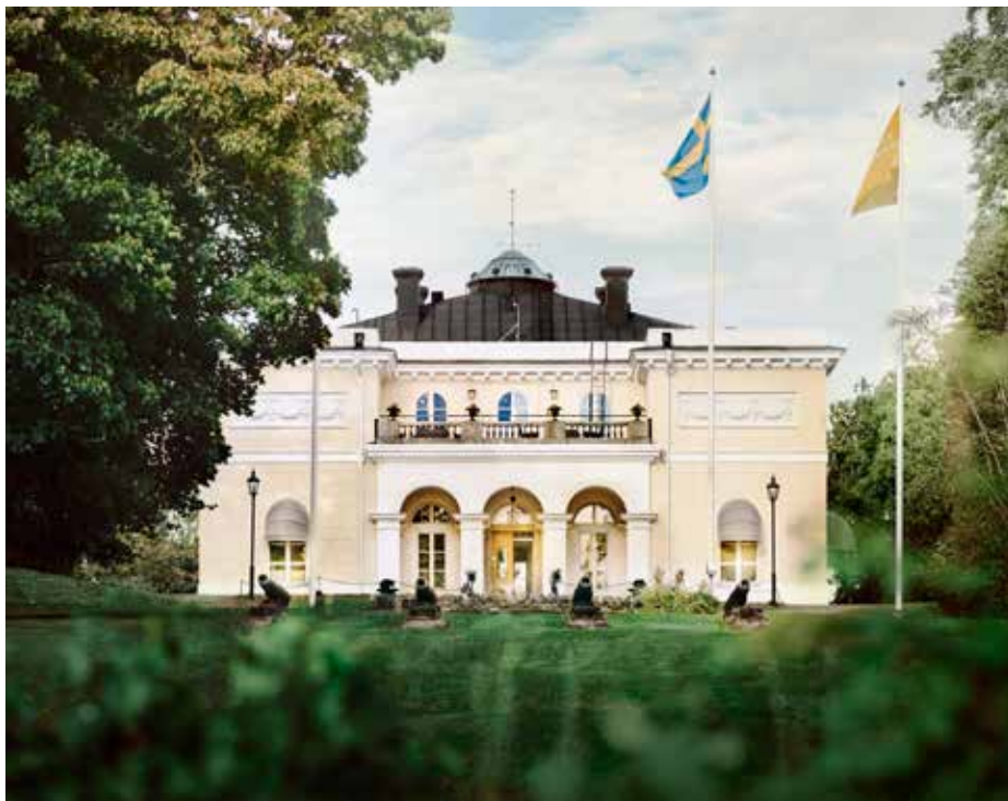
Villa Aske i sommarskrud (bilden kanske känns igen från omslaget i förra numret)

-08:00 Frukost -09:00-12:00 Seminarier: släktingar håller intressanta föredrag -12:30 Lunch -Hemfärd