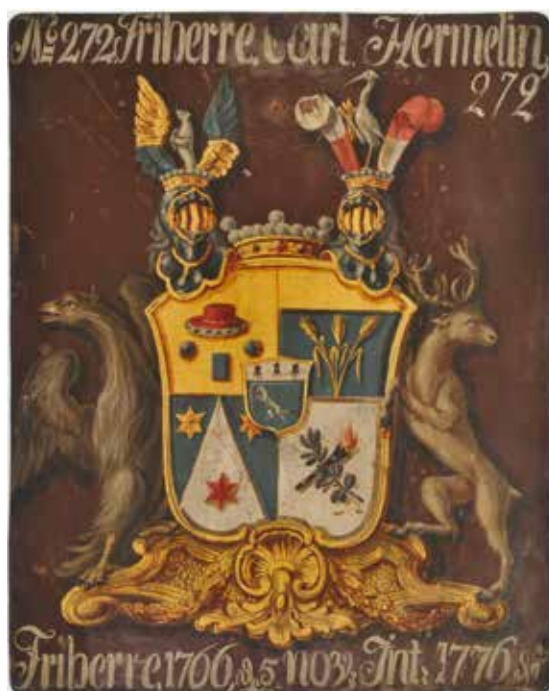
Vår friherrliga vapensköld

års regeringsform (§37) infördes en begränsning av adelskapet i de ätter som