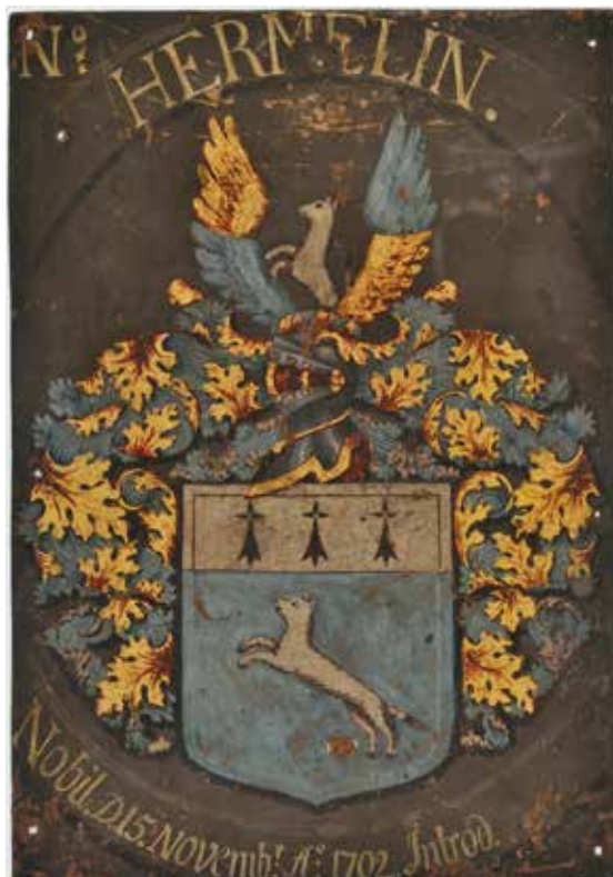
Vår adliga vapensköld

Adelskapet följer inte ett visst släktnamn. En person blir inte adlig för att den upptar sin adligt födda hustru, mors eller styvfars efternamn. En kvinna som gifter sig adligt räknas till mannens ätt så länge de är gifta, också om hon blir änka – men