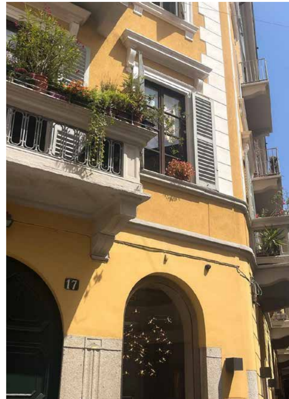
The dream apartment at Via Madonnina 17 in Brera, Milano

During my master's degree time I was able to both refresh my old knowledge as well as learn many new things. Compared to the bachelor's degree, the master's degree was more hands-on and opened many doors. I got the amazing opportunity to work with prestigious