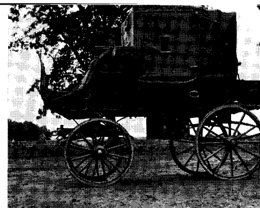
Från Gripenberg eller Traneryd i Småland för gamlebaronen nattetid i ”sovarevagn” till Rehnstad.

Och mitt ned i denna värld av arbetare, statarkvinnor, pojkar körande oxar, enorma böljande sädesfält, ned bland mekaniska anordningar för av- och bevattning sänkte sig som en högre makt ”Gamle-Baron”. Han kom under den bråda skördetiden åkande landsvägen från Gripenberg eller Traneryd i Småland nattetid, under dessa säregna ”sovarevagns”-turer i enkla, täckta britschkor, d.v.s. flatbottnade vagnar, med fyrspann eller parhästar. Baktill på vagnen fanns plats för fastspänning av bagage, inuti en regelrätt bädd på bottnen. På kuskbocken satt förutom kusk en tioårig grindpojke. Sålunda, utan att besväras eller tröttnas under turen på 45 km. och därtill med ett ekipagebyte efter midnatt i Rosendal eller Trehörna, anlände farfar i den tidigaste gryningen till Rehnstad. Väl kunde han ta sig en dags vila efter turen, men ibland, återigen, aktade