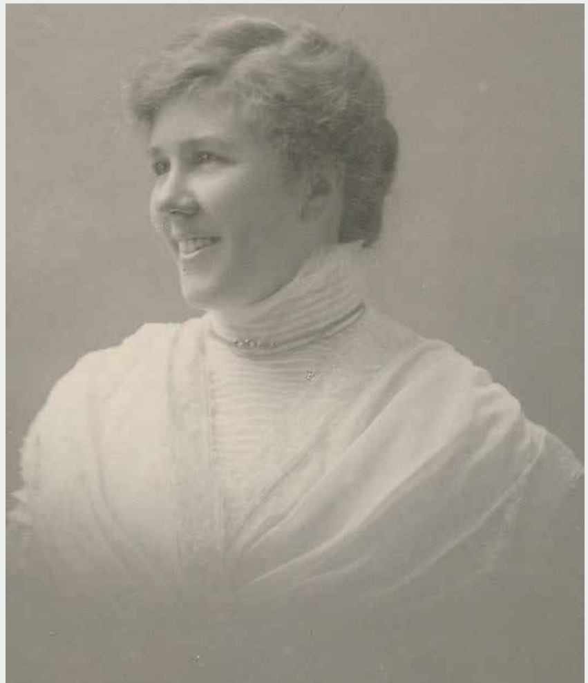
Gunni omkring år 1951