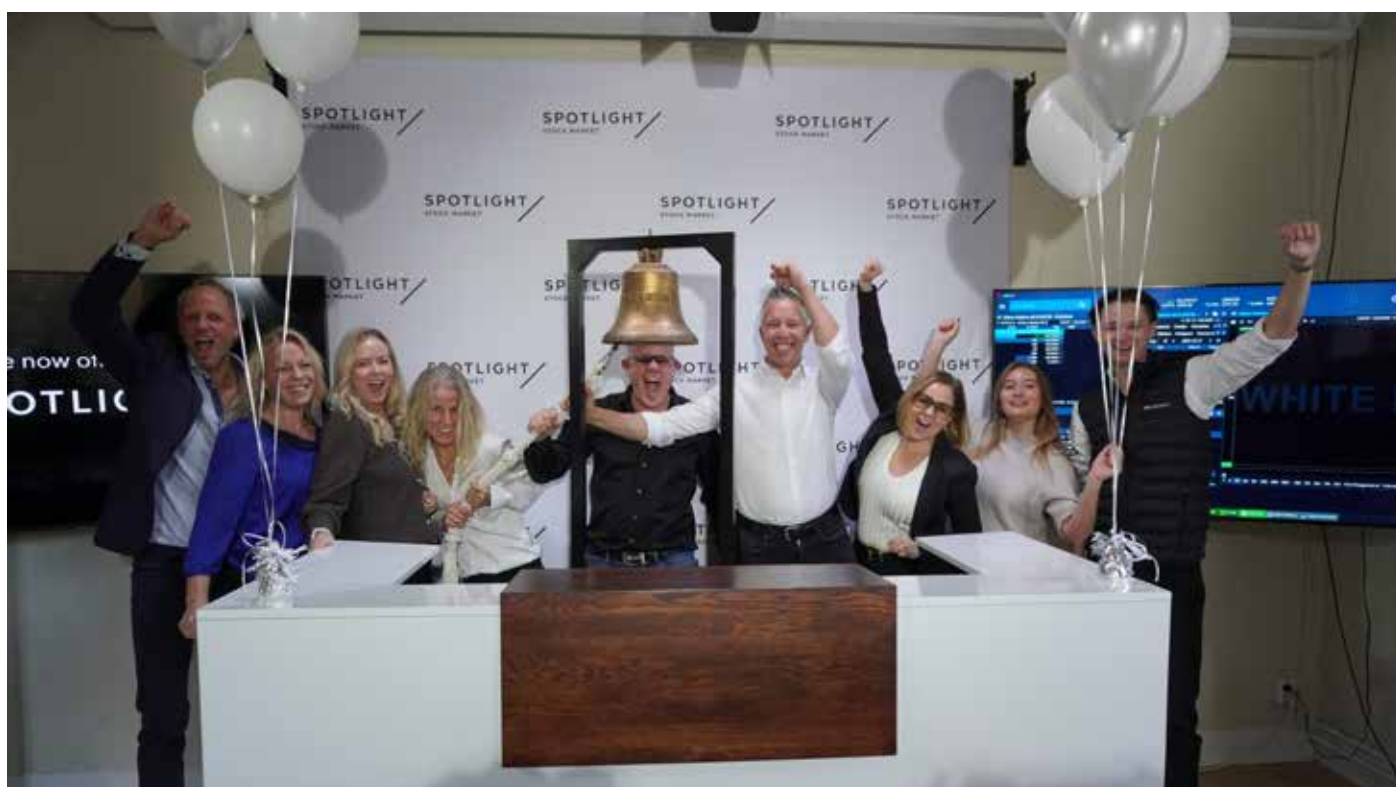
Hela gänget från White Pebbles och Hermelin Equity ringer i klockan på Spotlight den 17 oktober 2025