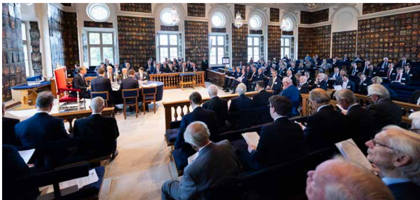
Adelsmötet